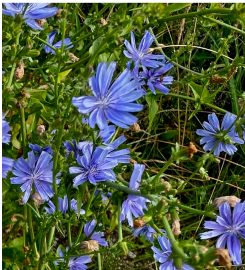
Die Wegwarte Cichorium intybus